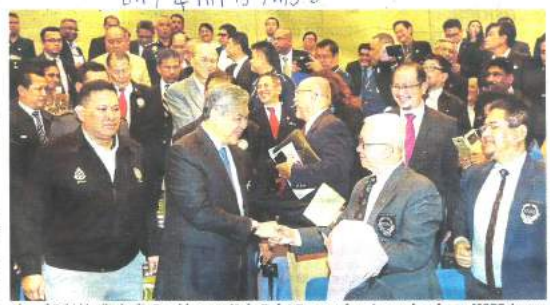
Ahmad Zahid ketika hadir Persidangan Meja Bulat Pencegahan Jenayah anjuran MCPJF dengan kerjasama PEMANDU di Kuala Lumpur, semalam.

dan Pelaksanaan (PEMANDU) akan bekerjasama dengan Kementerian Dalam Negeri dan Polis Diraja Malaysia (PDRM) melihat keberkesanan dan kaedah sesuai dalam menangani kadar persepsi yang tidak naik walaupun kadar jenayah menurun," katanya pada sidang media di sini semalam.