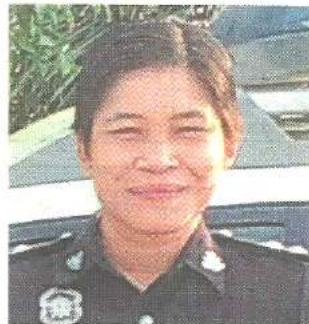
7 Nov. 8/9/15 MJS 33

THE Malaysia Crime Prevention Foundation (MCPF) views with utmost seriousness the latest tragedy involving a lady police officer being killed when she was hit by a Mat Rempit at a roadblock along Jalan Batu Pahat-Mersing in Johor, "Cop killed in road mishap" ( The Star , Sept 7).