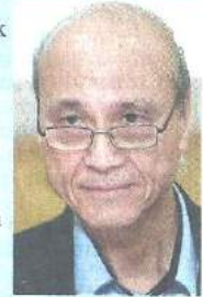
LEE LAM THYE

KUALA LUMPUR 24 Nov. - Yayasan Pencegahan Jenayah Malaysia (MCPF) menyokong penuh keputusan universiti awam di negara ini mengharamkan penggunaan rokok elektronik atau vape di kawasan kampus. Naib Pengerusinya, Tan Sri Lee Lam Thye mengalu-alukan keputusan berkenaan kerana vape bakal menjejaskan imej seseorang terutamanya yang bergelar mahasiswa yang selama ini dipandang tinggi oleh masyarakat.