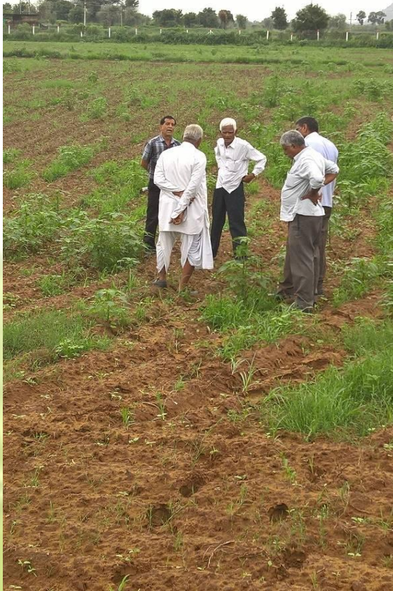
BASIC GUIDANCE AT A FARM