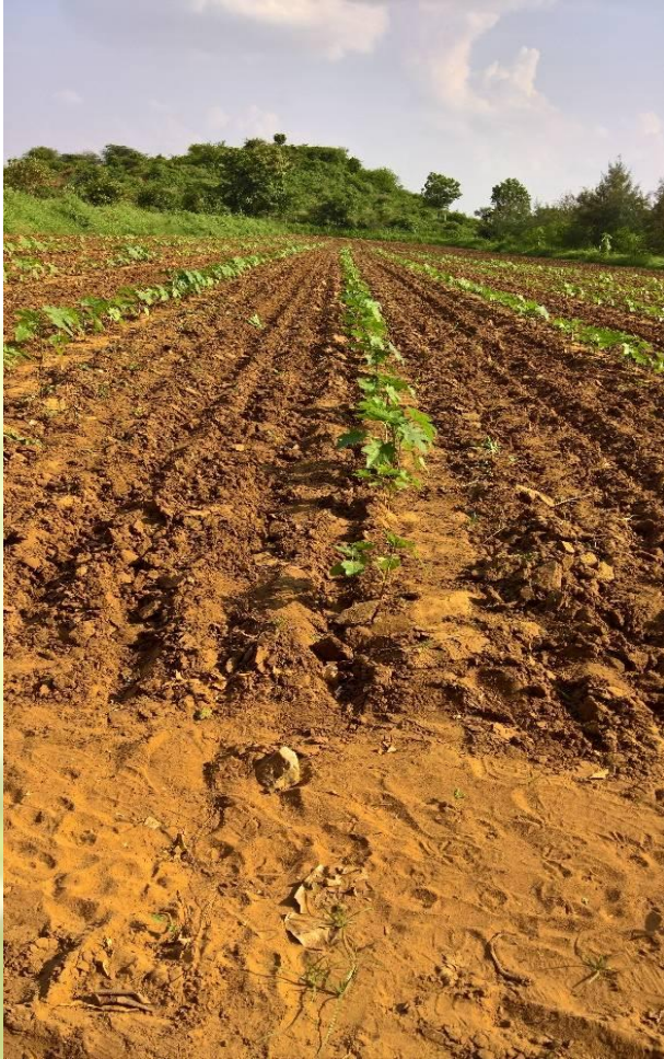
MOMENTUM OF TIME