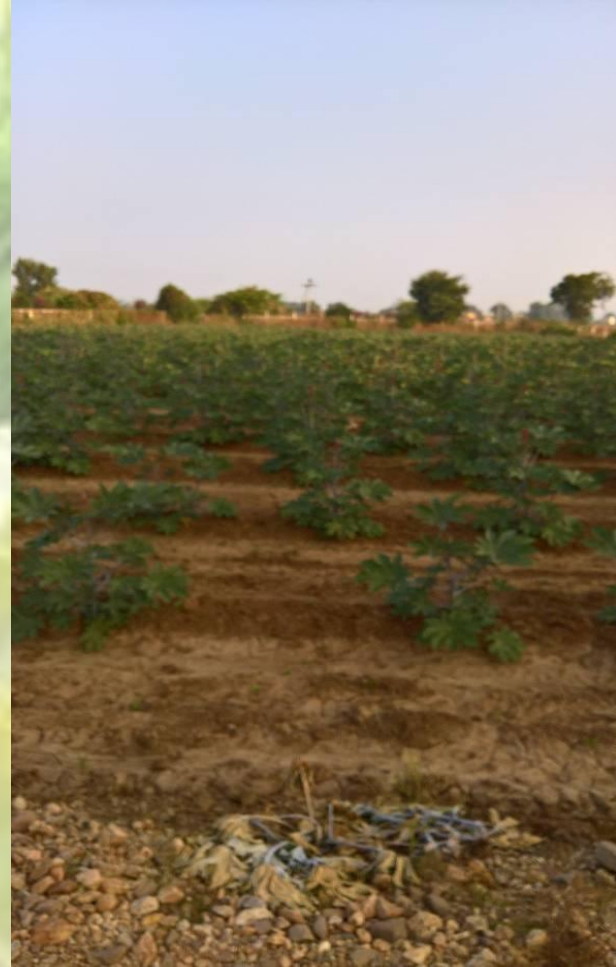
DISTANCING AT DISPLAY