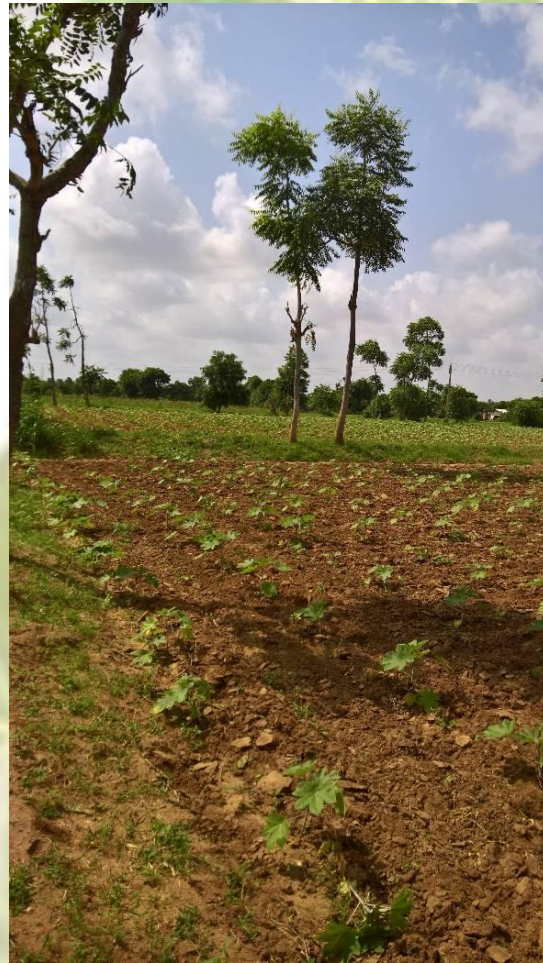
PROGRESSION AT THE FARM