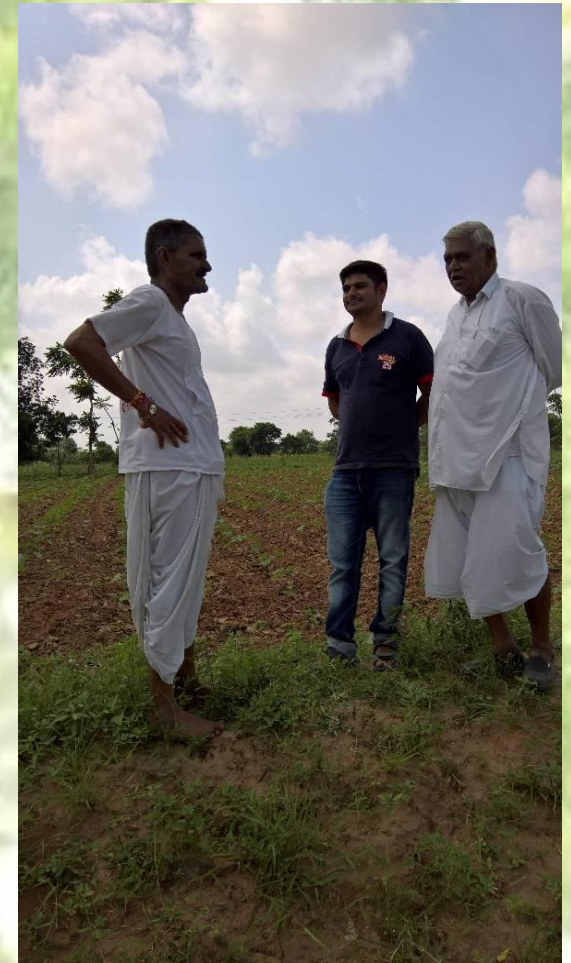
POST PLANTING GUIDANCE