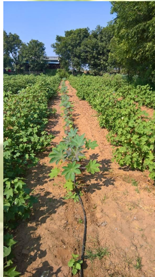
LATREL VIEW OF MULTIPLE CROPPING