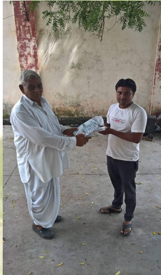
HANDING OVER OF PLANTING SEEDS