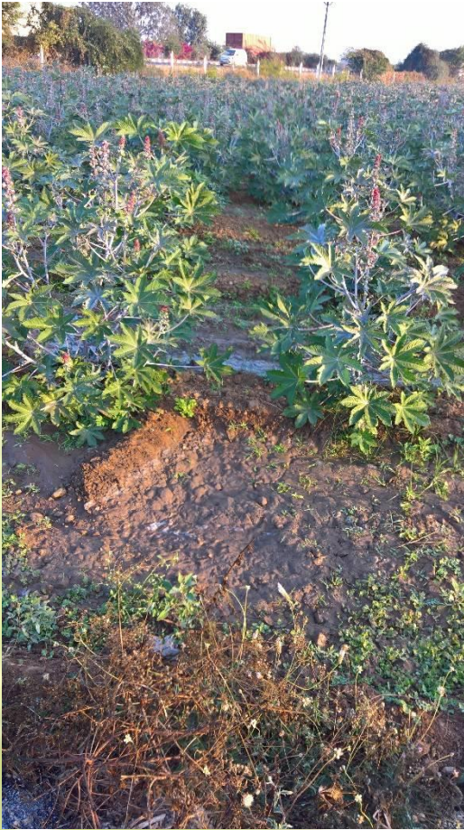
BLOOMING IN PROGRESS