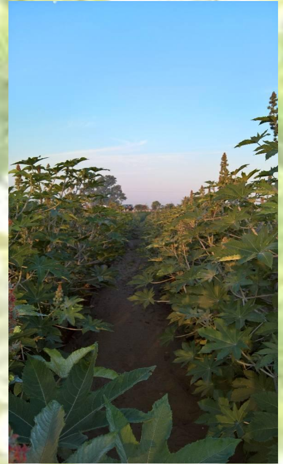
HAPPY TIME A HEAD