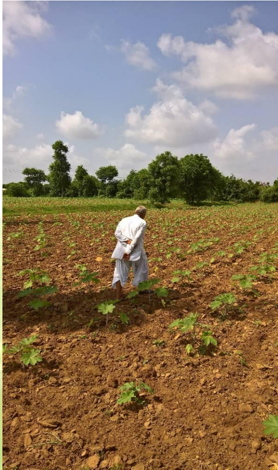
KEEN OBSERVER AT WORK