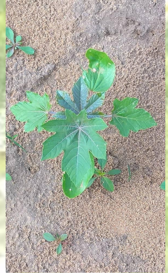
SPROUTING OF THE SEED