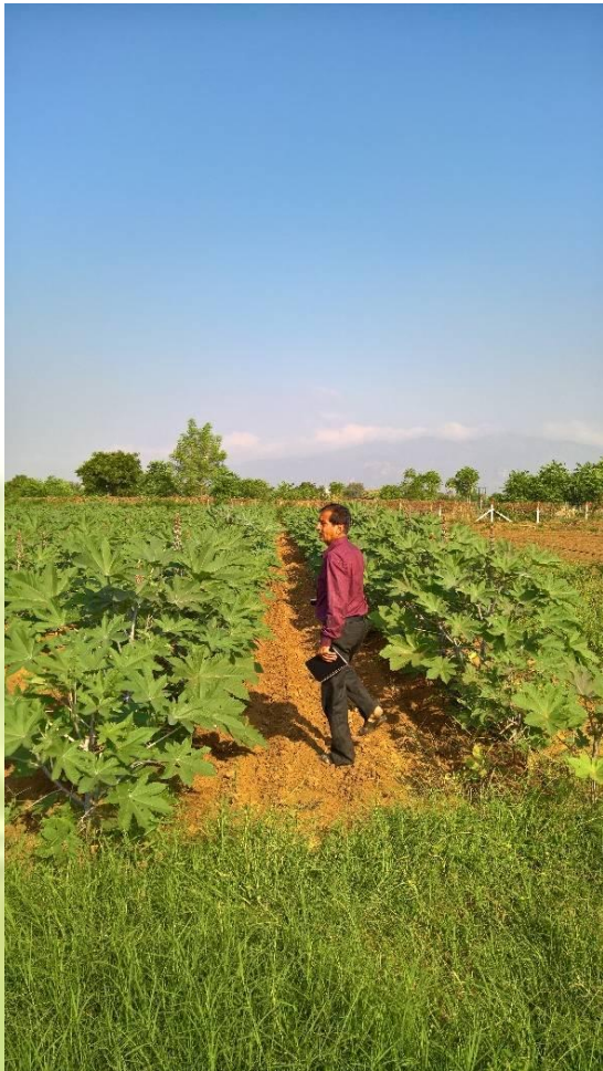
EXPERT AT WORK