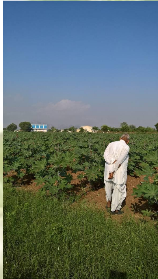
EXPERT AT WORK