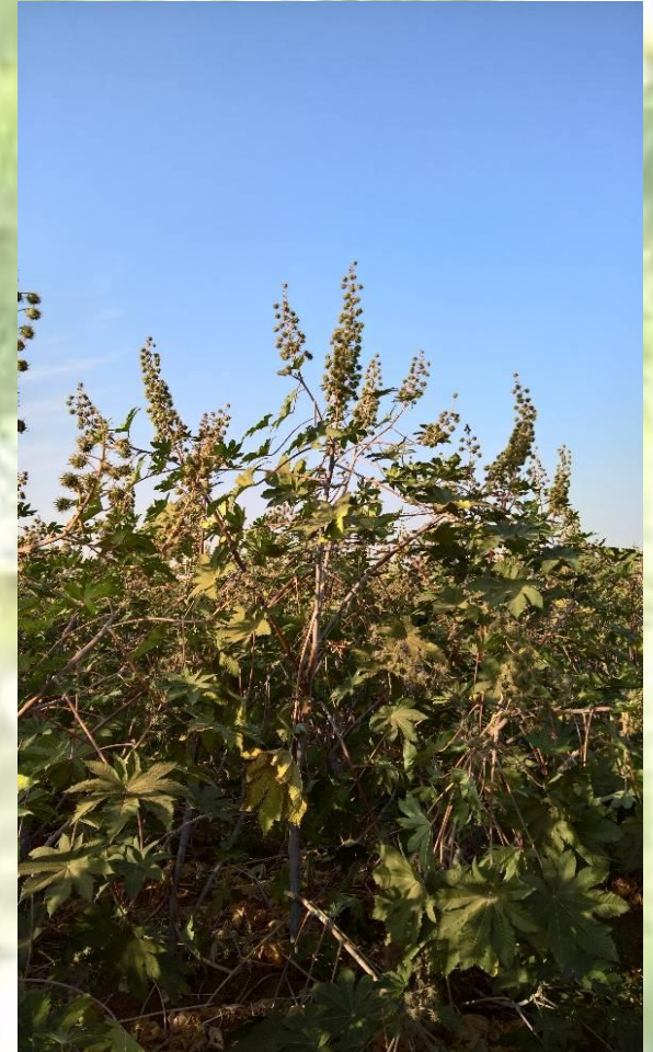
MODEL FARM ON THE DAY OF KISAN MELA