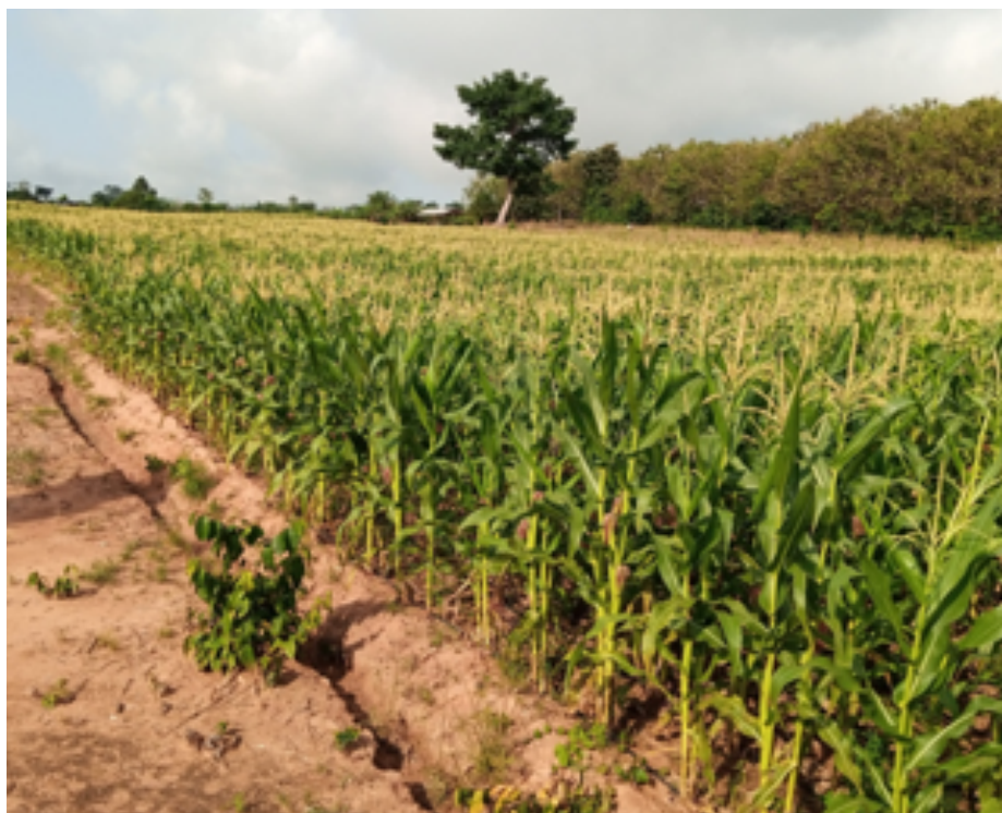
Un champ de maïs au Ghana. Une formation récente de l'AFSTA et de Croplife a mis l'accent sur l'importance de la conformité pour la réussite des projets de biotechnologie dans le pays.