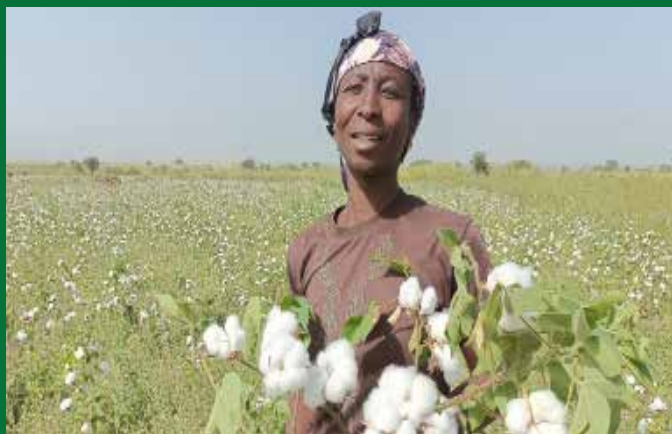
Légende du deuxième article - deuxième photo - Un cultivateur de coton Bt.

Le Comité identifiera et évaluera les possibilités nouvelles et existantes en biotechnologie ; participer activement à l'évaluation des risques et des avantages des nouvelles technologies biotechnologiques et diffuser des informations impartiales scientifiquement éprouvées au public kenyan.