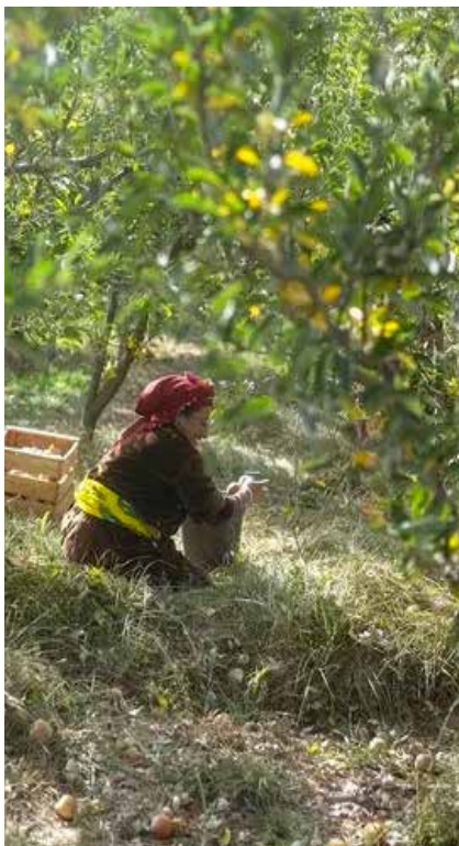
Agriculteur marocain : Le Pays a choisi de libéraliser son marché

L'année dernière, alors que le pays était en difficulté, Marchouch a atteint un rendement de quatre tonnes par hectare, avec seulement 200 millimètres de précipitations.