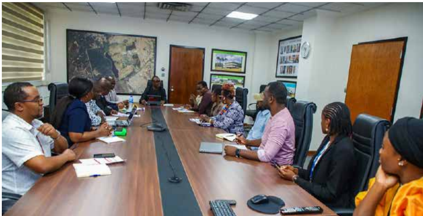
Des délégués angolais lors d'une visite à Ibadan, au Nigeria. La visite visait à renforcer le partenariat avec l'IITA afin de fournir des technologies éprouvées et un soutien aux petits exploitants agricoles du pays.